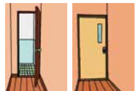
図2)トイレの扉の交換