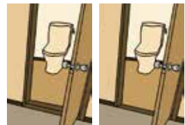
図1)トイレの段差解消

トイレ内に暖房を設置すること。トイレは排泄中、密室になりますので、空気を燃やさない輻射暖房の設置を検討しましょう。