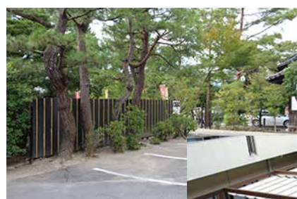
こだわり大和堀ユニット