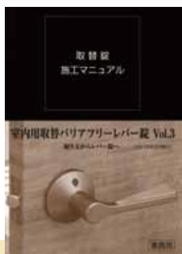
室内用取替 バリアフリーレバー錠 Vol.3