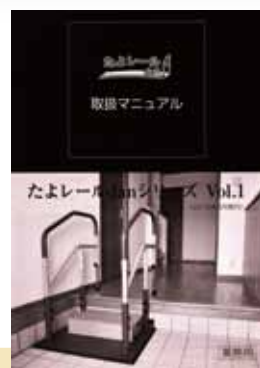
たよレールdan シリーズ Vol.1