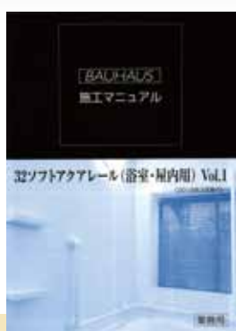
32ソフトアクアレール (浴室・屋内用) Vol.1