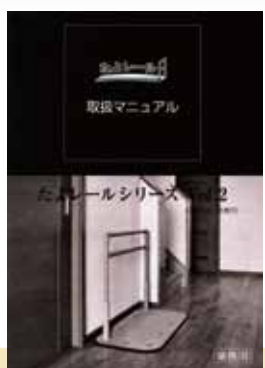
たよレールシリーズ Vol.2