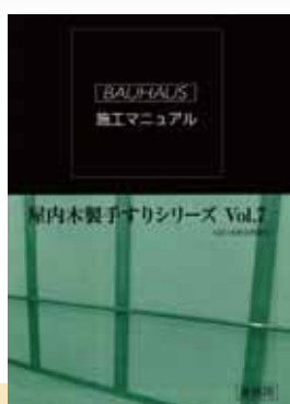
屋内木製手すり シリーズ Vol.7