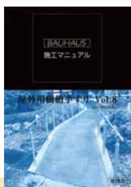
屋外用樹脂手すり Vol.8