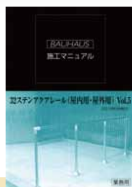
32ステンアクアレール (屋内用・屋外用) Vol.5