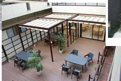
コントラクトデッキ