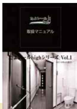
たよレールhigh シリーズ Vol.1