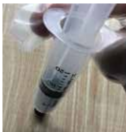
変成シリコン樹脂 容量：40ml