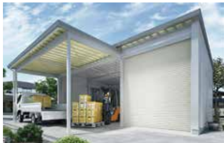
SGN-358GPN-3 設置イメージ 下屋、壁面扉はオプション

指定建築材料使用の軽量鉄工造。 農業機械の格納、車庫、作業場として使い勝手抜群。